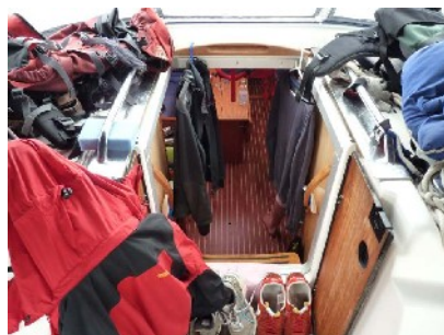
Kleidung trocknen nach dem Gewitter ...

Auch im weiteren Verlauf war das Wetter nicht so stabil wie um diese Jahreszeit gewohnt, und kleinere Schauer begleiteten uns einige Tage, allerdings bei komfortablen Temperaturen von selten unter 26°.