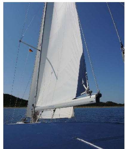
Das neue Groß steht perfekt!

Nach knapp 300 Seemeilen – rund die Hälfte mit Hilfe unseres Volvo – kamen wir nach zwei Wochen wieder zurück in unsere Marina Lefkas.