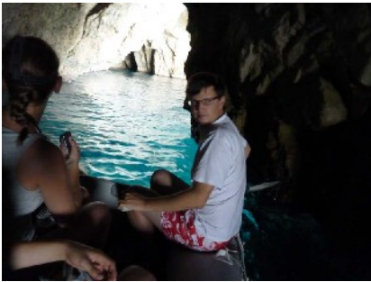
in der "blauen Lagune" auf Paxos