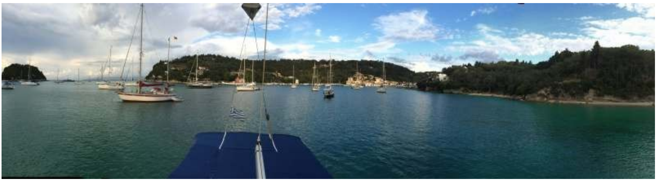
Panorama der Bucht von Lakka/Paxos

satzungen, Kämpfen, Belagerungen, von denen zwei massive Festungsanlagen („alte“ und „neue“ Festung, die „neue“ stammt aus dem 16. Jahrhundert) zeugen.