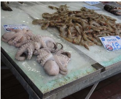
Markt in Korfu