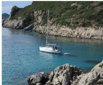
Porto Timoni nahe Georgios/Korfu