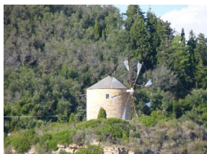
Windmühle auf Erikousa