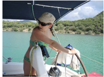
Ankermanöver üben, üben, üben...