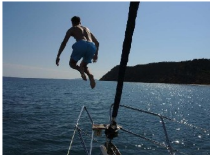
Badespaß im 25° warmen Wasser