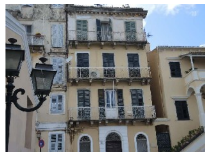
Italienisches Flair in Korfu

Korfu Stadt hat eine wechselvolle Geschichte mit langen Perioden venezianischer Herrschaft, aber auch diversen Be-