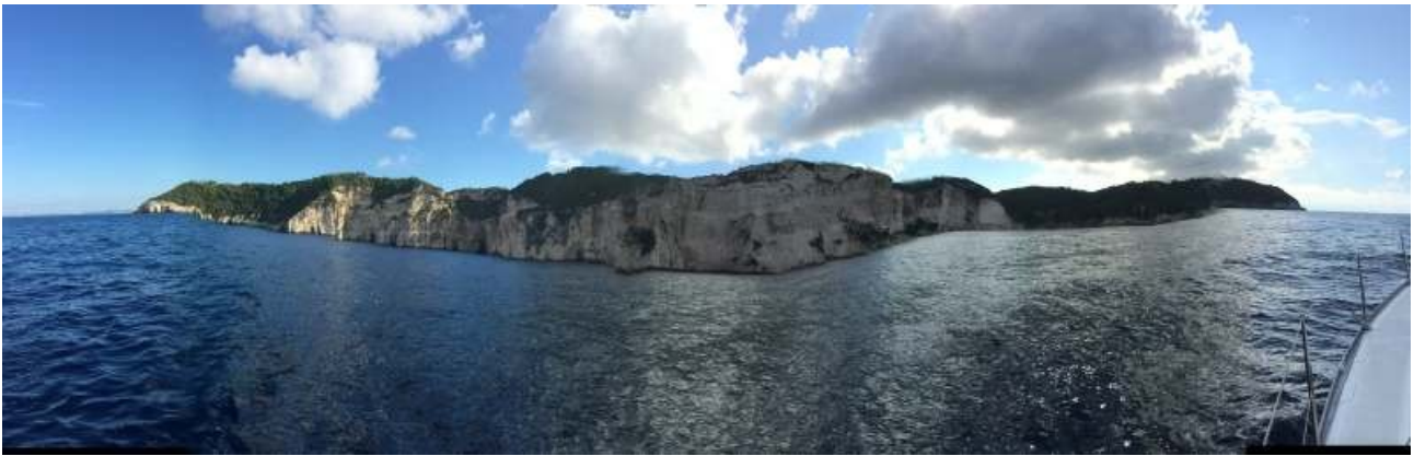
Westküste der Insel Paxos im Weitwinkel