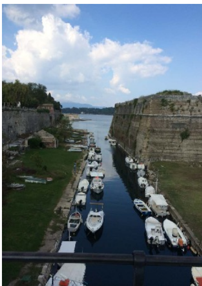
Kanal an der alten Festung von Korfu

In der sehr verschwiegenen Bucht von Imerolia an Korfus Nordküste, knapp 4 Seemeilen Luftlinie von der albanischen Küste entfernt, taucht am Abend kurz vor Sonnenuntergang auf dem Kai ein Zugfahrzeug mit Bootsanhänger auf. Es wird ein offenes Rennboot zu Wasser gelassen, Typ „Cigarette Top Gun 39“, zwei 8-Zylinder-Motoren je ca. 700 PS, das