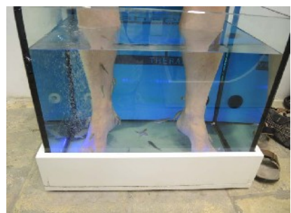
In der Fish Spa - hier in Korfu - pediküren Fischlein die müden Seglerfüße